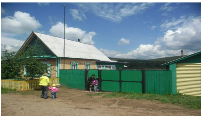
Благоустриваем личные домовладения