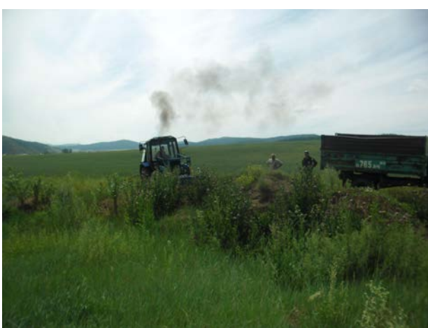
Уничтожение запахиванием дикорастущей конопли