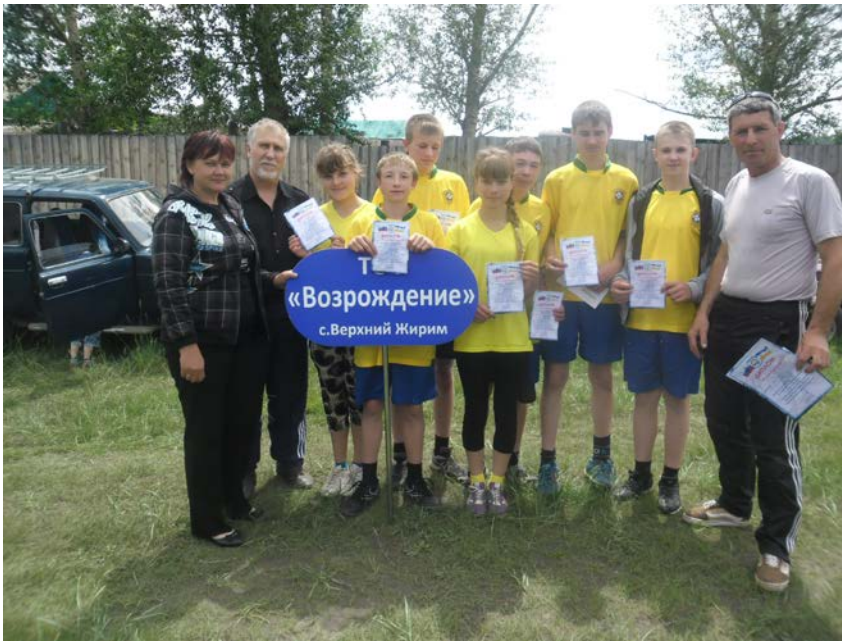
Команда ТОСа – бронзовые призеры соревнований по русской лапте