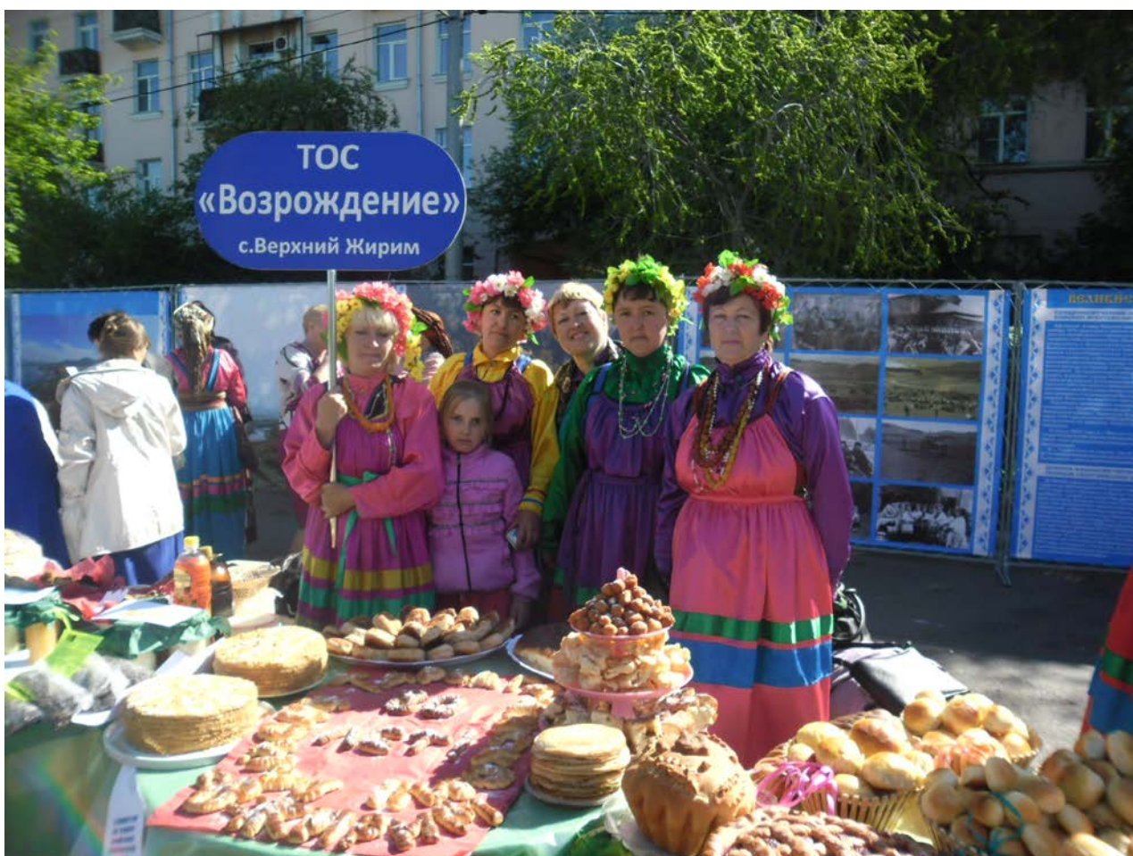
Празднуем 90-летие Республики Бурятия