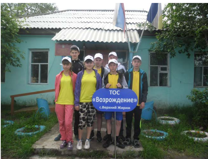
К работе активно привлекается молодежь села.