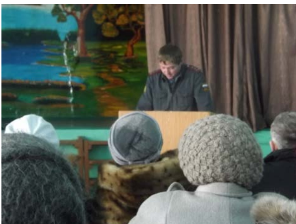
Лекцию жителям читает сотрудник службы по борьбе с наркотиками Бурятии