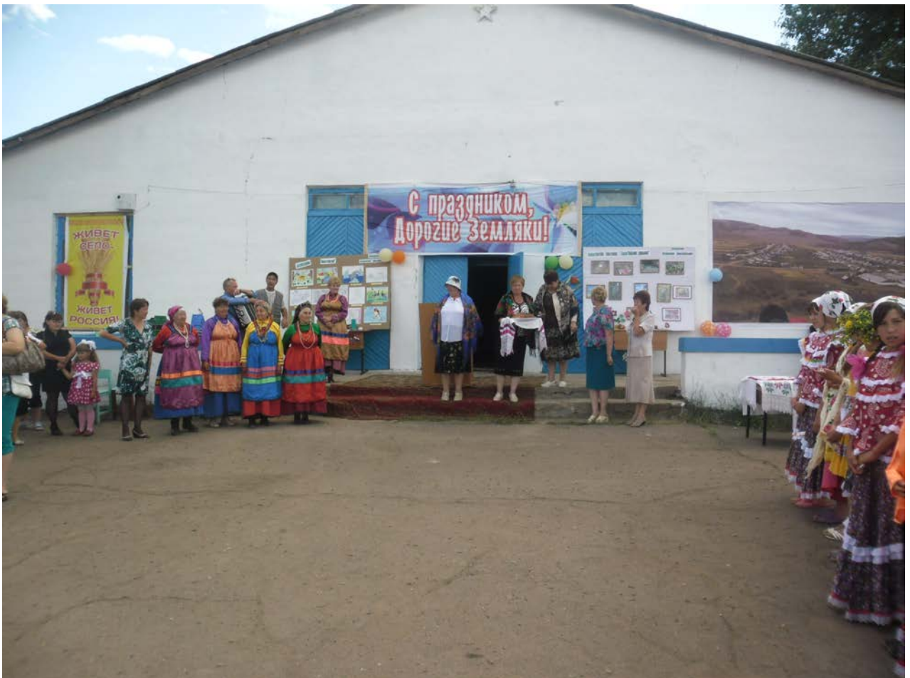
Празднуем «День Верхнежиримского поселения»